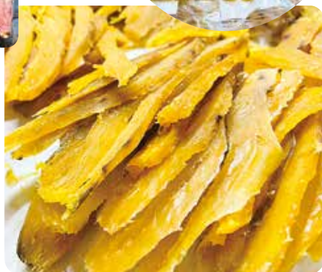
干し芋の出来上がりの様子