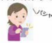
カメラを起動して 源泉徴収票を撮影