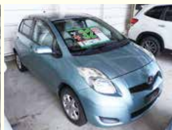
トヨタ ヴィッツ 年式 平成21年 4WD 走行距離 98千km 32万円