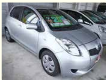
トヨタ ヴィッツ 年式 平成19年 2WD 走行距離 61千km 20万円