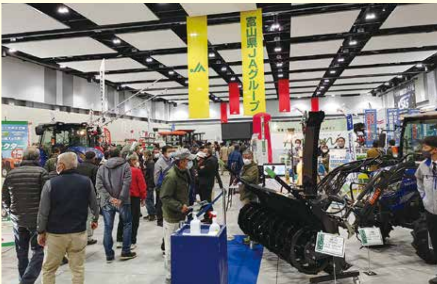
最新農機や除雪機が並ぶ会場を見物する来場者