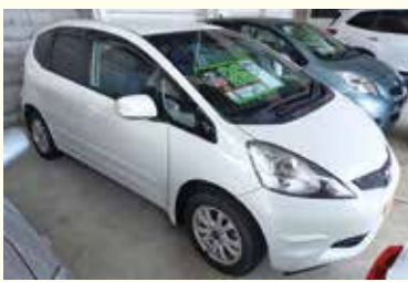
ホンダ フィット 年式 平成21年 2WD 走行距離 44千km 26万円