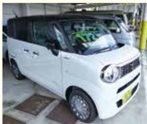
スズキ スマイル 軽未使用車 年式 令和3年 4WD 走行距離 2km 172万円

当店にて展示してありますので、お気軽にご来店下さい。詳細はスタッフにお問合せ下さい。