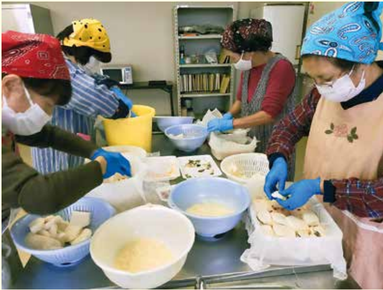
容器にカブと米麴、ニンジンを漬け込む参加者

地元の女性加工グループ「ふるさとの味加工組合」のスタッフが講師となり、「かぶら寿し」の作り方を教えました。参加者はカブを切った後、用意された塩漬けのカブに酢漬けのサバを挟み、米麴