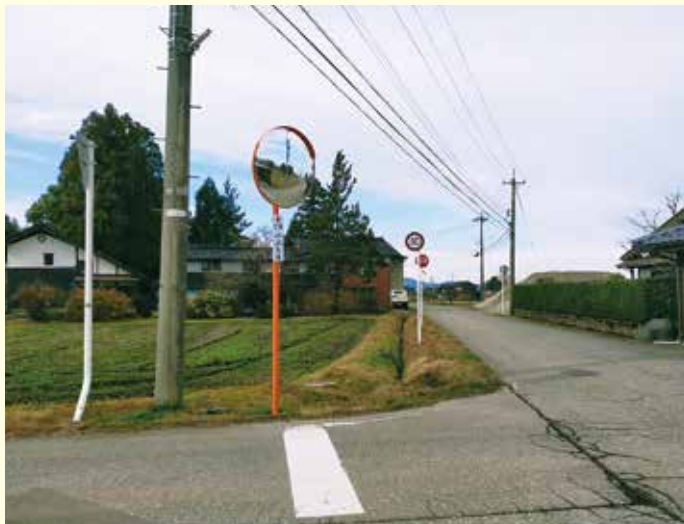
金戸（城端地域）の交差点に設置されたカーブミラー