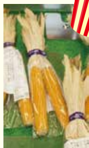
▲ポップコーン用とうもろこし