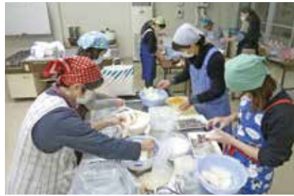
▲さばをはさんでおいしくなあれ

J A女性部が主催するかぶらずし講習会が、12月5日・8日に愛菜ふれあい館で開催され、20名の方々が参加されました。初日は、下漬けとして切ったかぶを塩漬けし、その後、エコープマーク品の「米こうじ」を使った甘酒の作り方を教わりました。2日目は、各自が自宅で作った甘酒を持ち寄り、ご飯を混ぜて麴床を作りしました。メさばをはさんだ塩漬けのかぶに、麴床とにんじん、旬のゆずを散らしました。参加者は、「麴菌の働きで甘くなった甘酒に