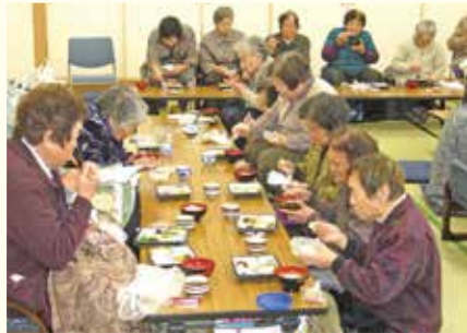
◆新聞紙で 指先を使った体操 食事も皆で食べると 美味しい！←