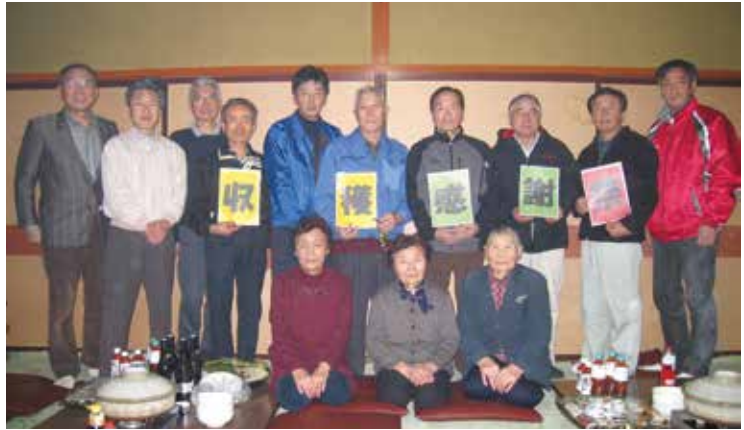
▲収穫感謝祭の様子