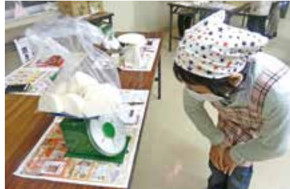
▲重さを量って分量を調整

驚きました。かぶらずしは初めてでも手軽にできたので、これからは家でも作ってみようかな」と郷土料理の手作りに意欲を高めていらっしゃいました。