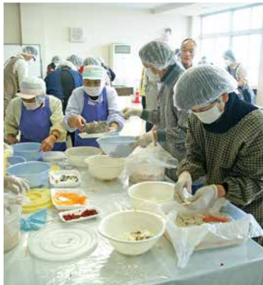
▲「かぶら寿し」を漬ける参加者

12月4日、JAなんと愛菜ふれあい館で「大カブの収穫とかぶら寿しづくり体験」を開催し、県内外から28人が参加しました。「かぶら寿し」は、正月の定番料理として、富山県西部地方だけでなく、広く石川県でも作られています。最近ではスーパーで買う方もいらっしゃると思いますが、ご家庭の味を楽しんでいただくことを目的に毎年開催されています。