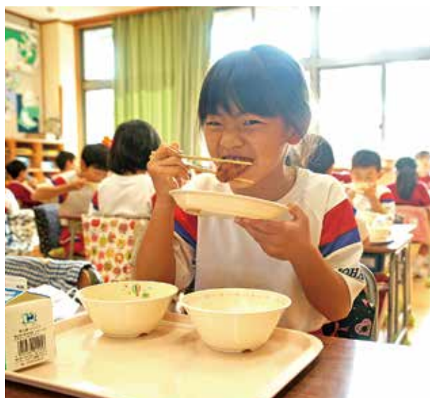
▲「にんにくコロッケ」をほおぼる児童

11月21・22日、特産の「にんにく」を使った「にんにくコロッケ」を管内の小・中学校6校の給食に提供しました。これは、管内の子どもたちに地元の農や食に関心を持ってもらうために実施しました。J A なんとでは、「にんにく」の産地化に取り組み、平成26年からは、地産地消の一環として地元の食材のみを使用した「にんにくコロッケ」の販売を開始し、各種イベントなどでPR販売を行っています。