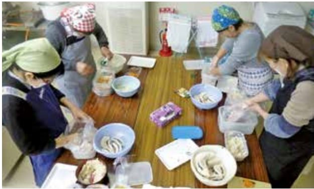
▲さあ、いよいよ本漬け(12月8日)