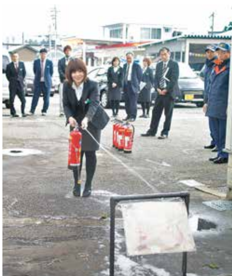
▲消火器訓練を受ける職員

火災を起こさないことは何より大事ですが、いざというときの備えをしっかりとっておきましょう。