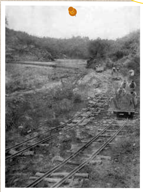
▲赤祖父溜池築造工事の様子と思われる写真 (昭和15年頃)

井口・川上中地区にある赤祖父ため池は、昭和初期のころまで水争いが絶えなかったことから昭和7年、受益者からの強い要望で県営事業として起工されました。戦時の労働力不足で工事は遅延しながらも昭和20年によりやく完成しました。