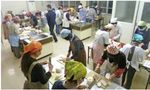
▲かぶを切って下漬けの準備(12月5日)

驚きました。かぶらずしは初めてでも手軽にできたので、これからは家でも作ってみようかな」と郷土料理の手作りに意欲を高めていらっしゃいました。