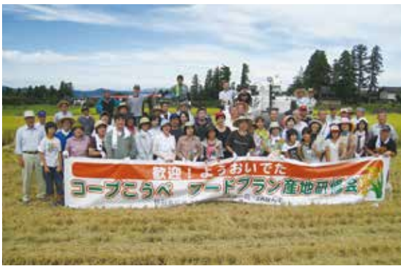
▲コープこうべ稲刈り体験での記念写真

年々厳しくなる農業情勢の中、的確に対応して結束力を高め強固な基盤とするため、農業法人化に取組み、育苗にかかる労働力等の軽減のため直播栽培面積を増やし、農業従事者の減少に伴う集落営農機能の維持を推進したいと考えている。