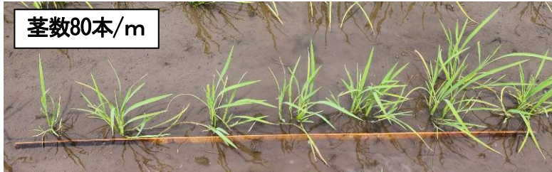
写真 コシヒカリ (鉄コ) 中干し開始時期