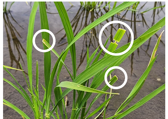
写真 イネゾウムシの被害葉

今年はやや多く発生しています。ヨーバルシード FSの種子塗抹を行っていないなど、被害が激しい場 合はご相談下さい。