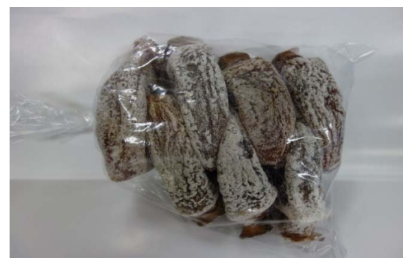
▲3L~5Lは7個入れ(3L~5L混ぜても可)

です。2Lは10個、3L~5Lは7個を、ヘタを外側にし、指定のポリ袋にいれ、生産者番号札を1枚外から見えるようにして入れ、袋をとめて(テープ等)出荷下さい。平核無柿のみLを15個詰めで出荷可。