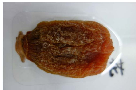
▲「花」とは頭欠5%以上20%未満

「花」は頭の欠けている割合が5%以上~20%未満のもので、2Lサイズ以上が出荷できます。欠けている割合が5%未満のものは、良品と同じで「○」として出荷できますが通い箱は別に。写真を参考にされて、出荷下さい。