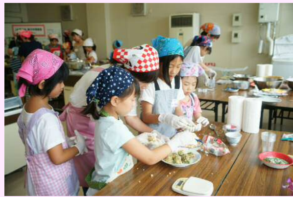
女性部 親子料理教室