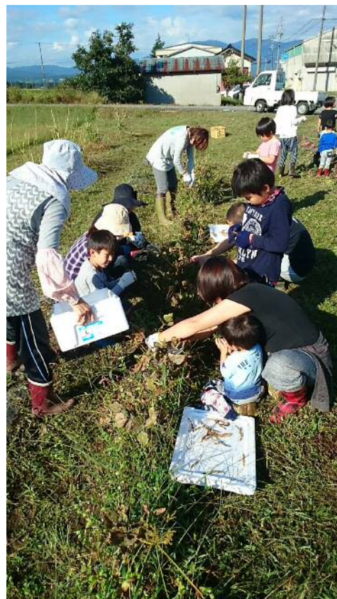
農協青壮年部 蓑谷支部