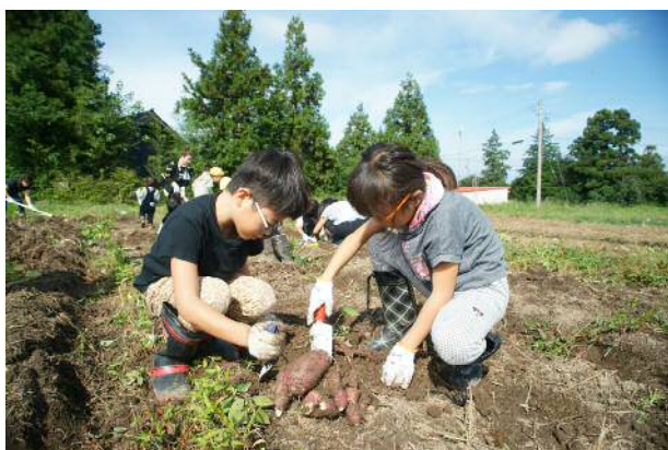
農協青壮年部 井口支部