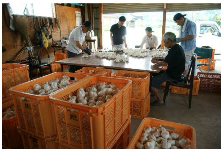
にんにく選別作業