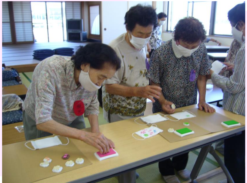
J A やすんごと会