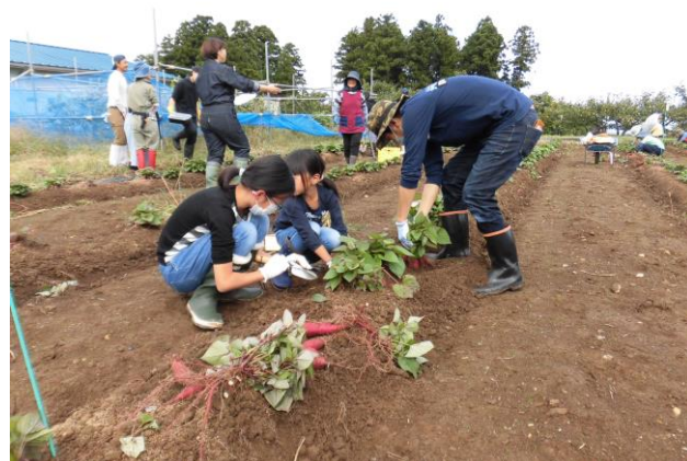
農協青壮年部 大鋸屋支部