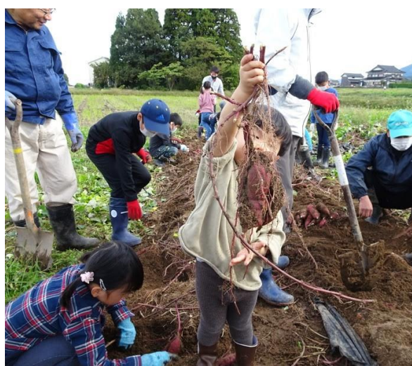
農協青壮年部 北野支部