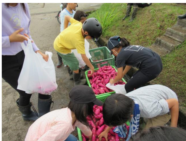
農協青壮年部 井口支部